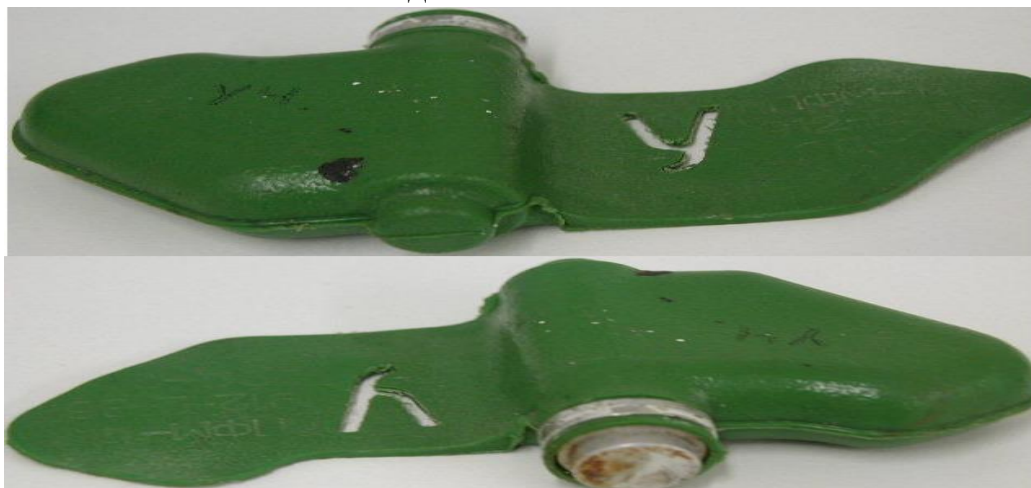
Внешний вид « Мины – ЛЕПЕСТКА »:

Масса мины 80 грамм, размеры – 12 x 6 сантиметров, чувствительность мины лежит в пределах 5-25 кг, что вполне достаточно для срабатывания от веса маленького ребенка.